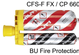
CFS-F FX / CP 660