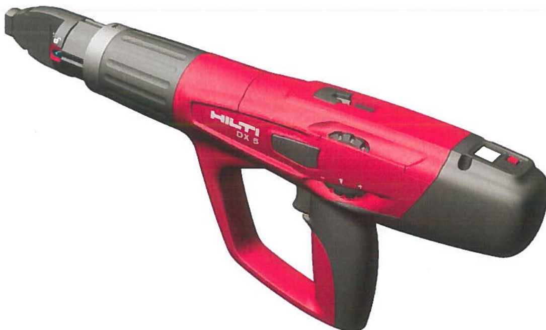
Abb.: Bolzenschubgerät DX 5 im Kaliber 6,8/11 M

Durch die Verwendung verschiedener Kolben und Kolbenführungen lässt sich der Anwendungsbereich des Geräts erweitern.